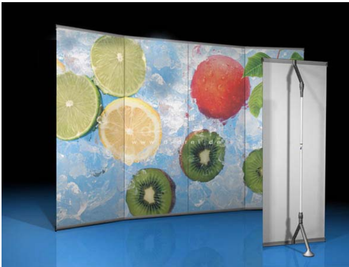
Best Stand 4